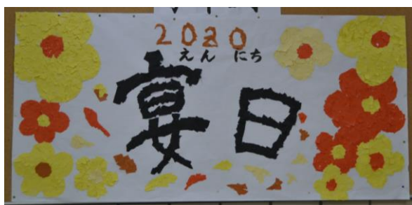
【ロビーに掲示された学校祭テーマ】

当日は、小学部低学年・中学年・高学年・中学部の発表を予定しております。多くの皆様にご覧いただきたいとは思っておりますが、今後の州政府のコロナウィルス感染防止対策により、保護者の方の入場数には制限がある場合もありますことをあらかじめご承知おきください。