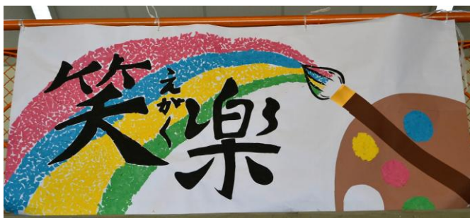
体育館のギャラリーに設置されているスローガン

児童生徒が主体的に取り組む活動は、学習面だけでなく子どもたちの心の成長にも大きく影響をもたらします。日頃の学習の成果も合わせて、みんな協力し合って素晴らしい行事に仕上がっていくことを期待しています。皆さんも是非応援してください。多数の保護者の皆様のご来場を心からお待ちしております。